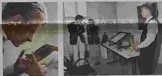
Der junge Künstler, rechts stehend, erklärt seine Arbeit (unten rechts).