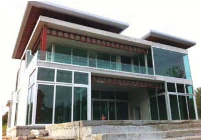
Phoenix Villa: First villa built in Thailand with long-span cellular structure.