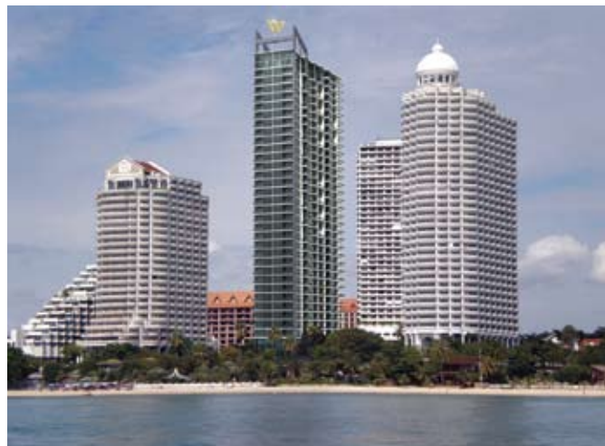
W-Tower: Iconic high-rise building W-Tower, Wong-Amat.