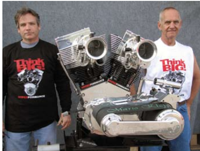
The only 222” (3.650cc) V-Twin with Nitrous for the street that has been built worldwide.